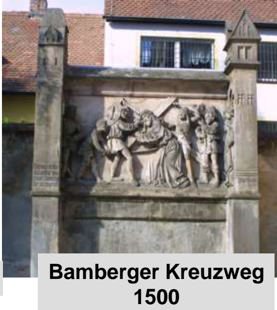
Bamberger Kreuzweg 1500