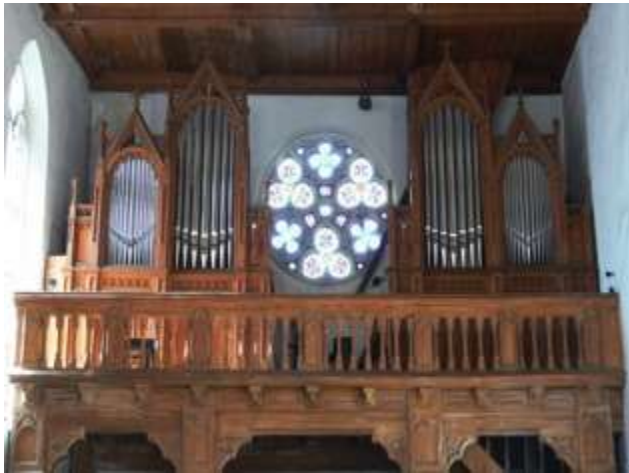
Orgel in St. Elisabeth, 1832