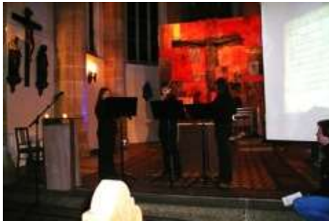
Musik um 1200